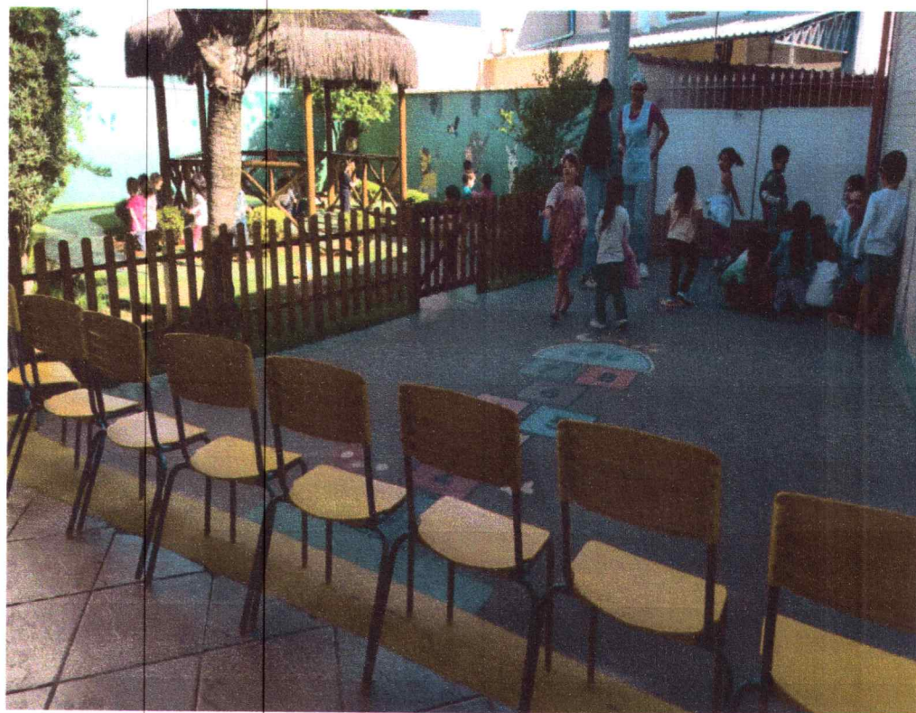
Brincadeira livre: procurando folhas secas